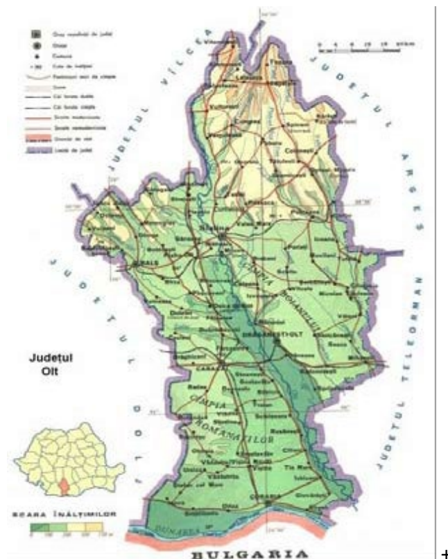
Figura 1: POZITIA GEOGRAFICA A PROIECTULUI

Judetul Olt se afla situat in Regiunea de dezvoltare 4 Sud-Vest Oltenia. Din punct de vedere administrativ, judetul Olt este compus din 2 municipii (Slatina si Caracal), 6 orase (Bals, Corabia, Draganesti Olt, Piatra Olt, Potcoava si Scornicesti) si 104 comune.